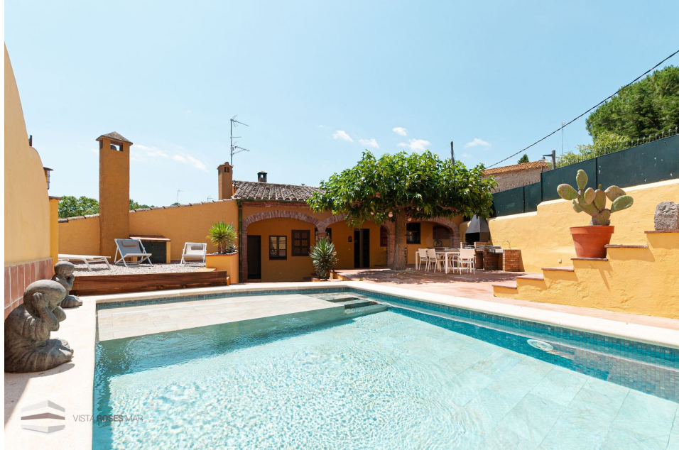
Alojamiento en Borrassà disponible a través de la plataforma Airbnb