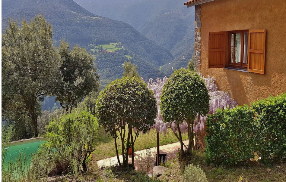
Alojamiento en el parque natural de Montseny disponible a través de la plataforma Airbnb

Junto al parque natural del Montseny y muy cerca de Barcelona, este pequeño pueblo conmemora cada año un evento llamado "Vot de Poble a Sant Marçal" (voto del pueblo a San Marcelo), que tiene su origen en una peregrinación para agradecer la intervención del santo contra la peste negra.