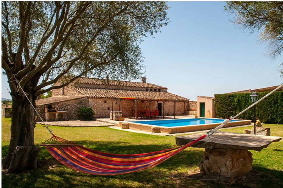
Alojamiento en Vilafranca de Bonany disponible a través de la plataforma Airbnb

Este pueblo ubicado en el interior de Mallorca es conocido por su deliciosa producción de melones, fruto al que dedican todo un día de fiesta deliciosa en la que se otorgan premios a los mejores ejemplares y se celebra una competición deportiva con melones como protagonistas, las llamadas "MiniMELOmpíades".