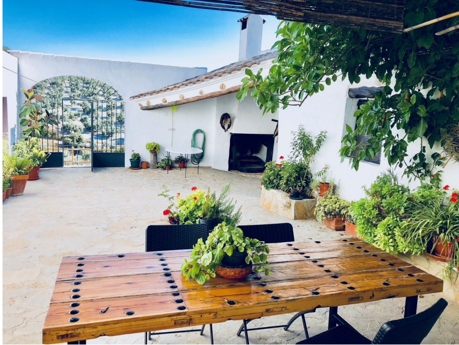
Alojamiento en Villanueva de Algaidas disponible a través de la plataforma Airbnb