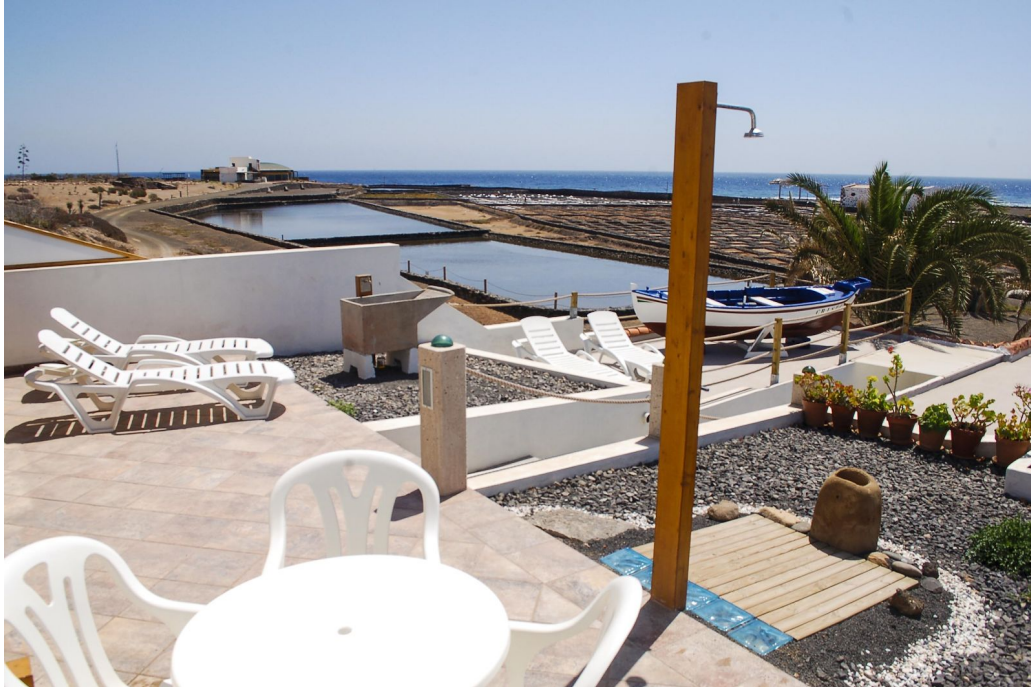
Alojamiento en Antigua disponible a través de la plataforma Airbnb