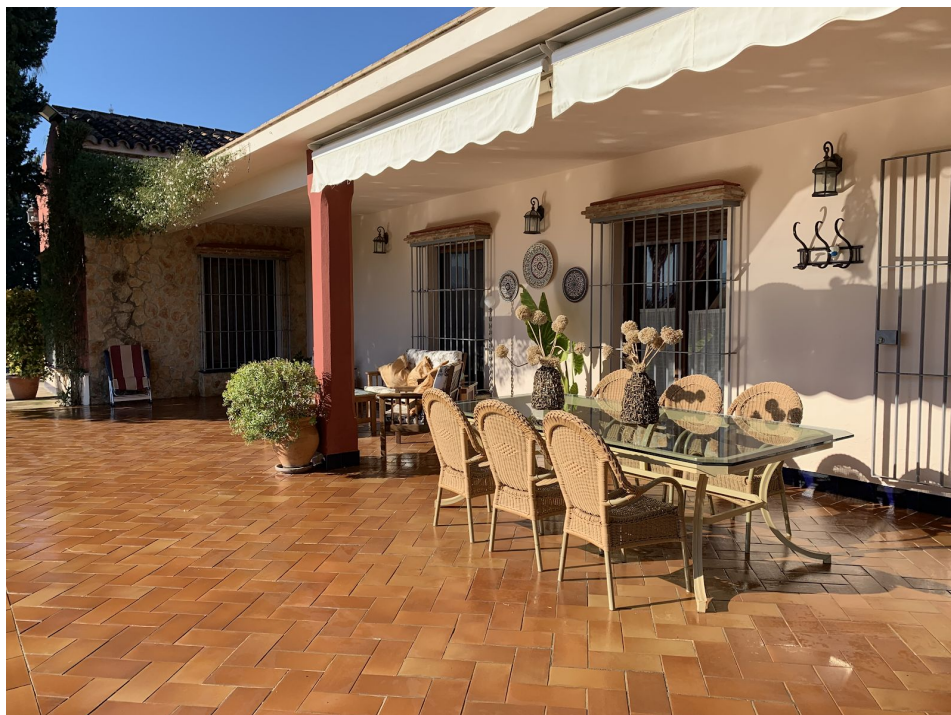
Alojamiento en Villamartín disponible a través de la plataforma Airbnb

Situado en la Sierra de Cádiz, Villamartín se ha coronado como el pueblo más hospitalario de España: tiene un índice de hospitalidad del 91% y es uno de los pueblos blancos de Andalucía, una de las rutas más pintorescas de la región.