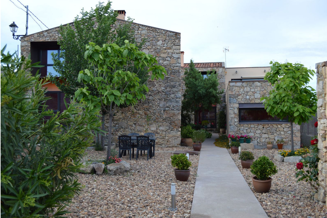
Alojamiento en Valencia de Alcántara disponible a través de la plataforma Airbnb.

Rodeada de bosques de alcornoques y por un conjunto de 41 dólmenes prehistóricos, Valencia de Alcántara formó parte de Portugal durante 24 años. Los que se acerquen a la localidad en agosto no se pueden perder sus fiestas de San Bartolomé, ni su recreación de la Boda Regia de la infanta Isabel con el rey de Portugal Don Manuel.