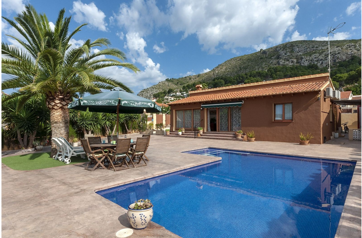
Alojamiento en Alcalalí disponible a través de la plataforma Airbnb