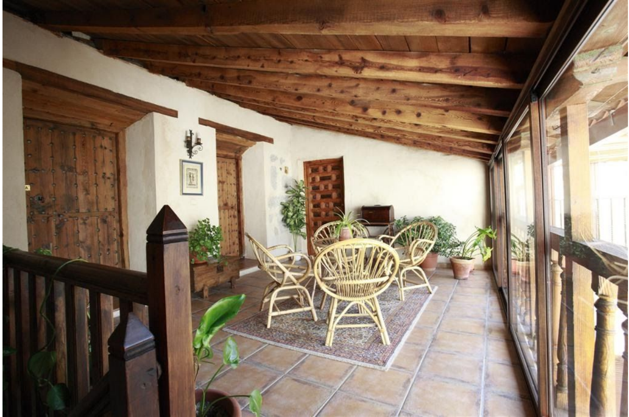
Alojamiento en Sonseca disponible a través de la plataforma Airbnb