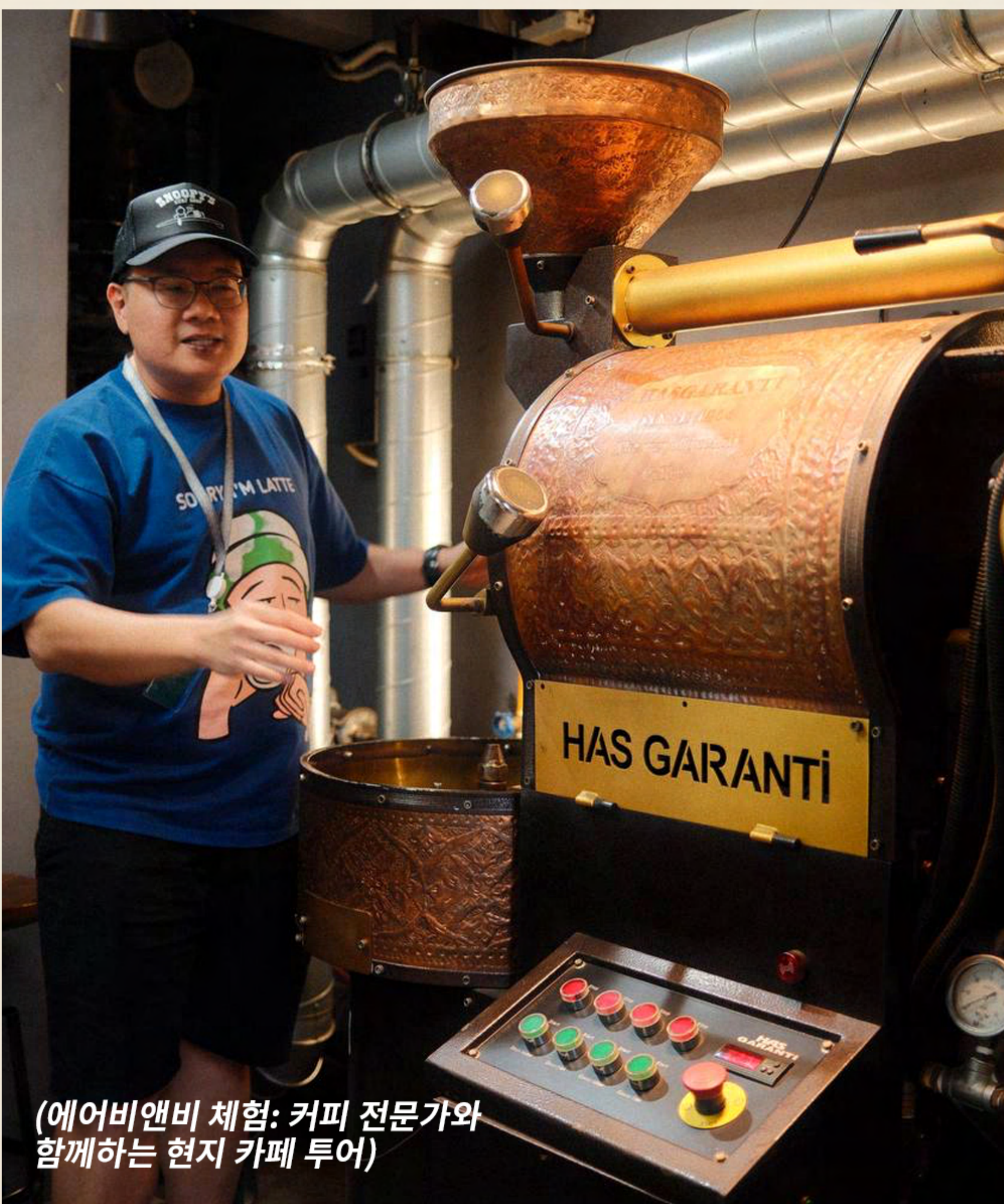
(에어비앤비 체험: 커피 전문가와 함께하는 현지 카페 투어)