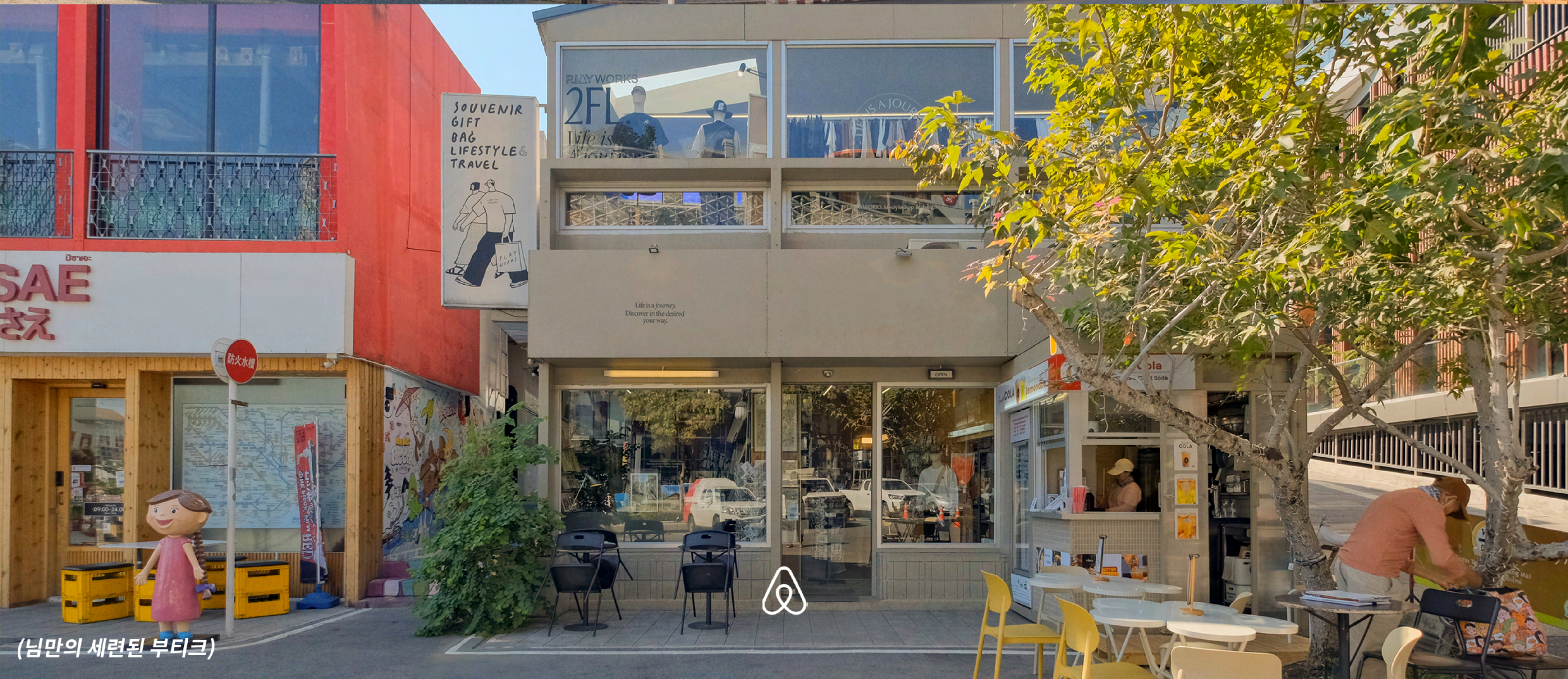
(님만의 세련된 부티크)