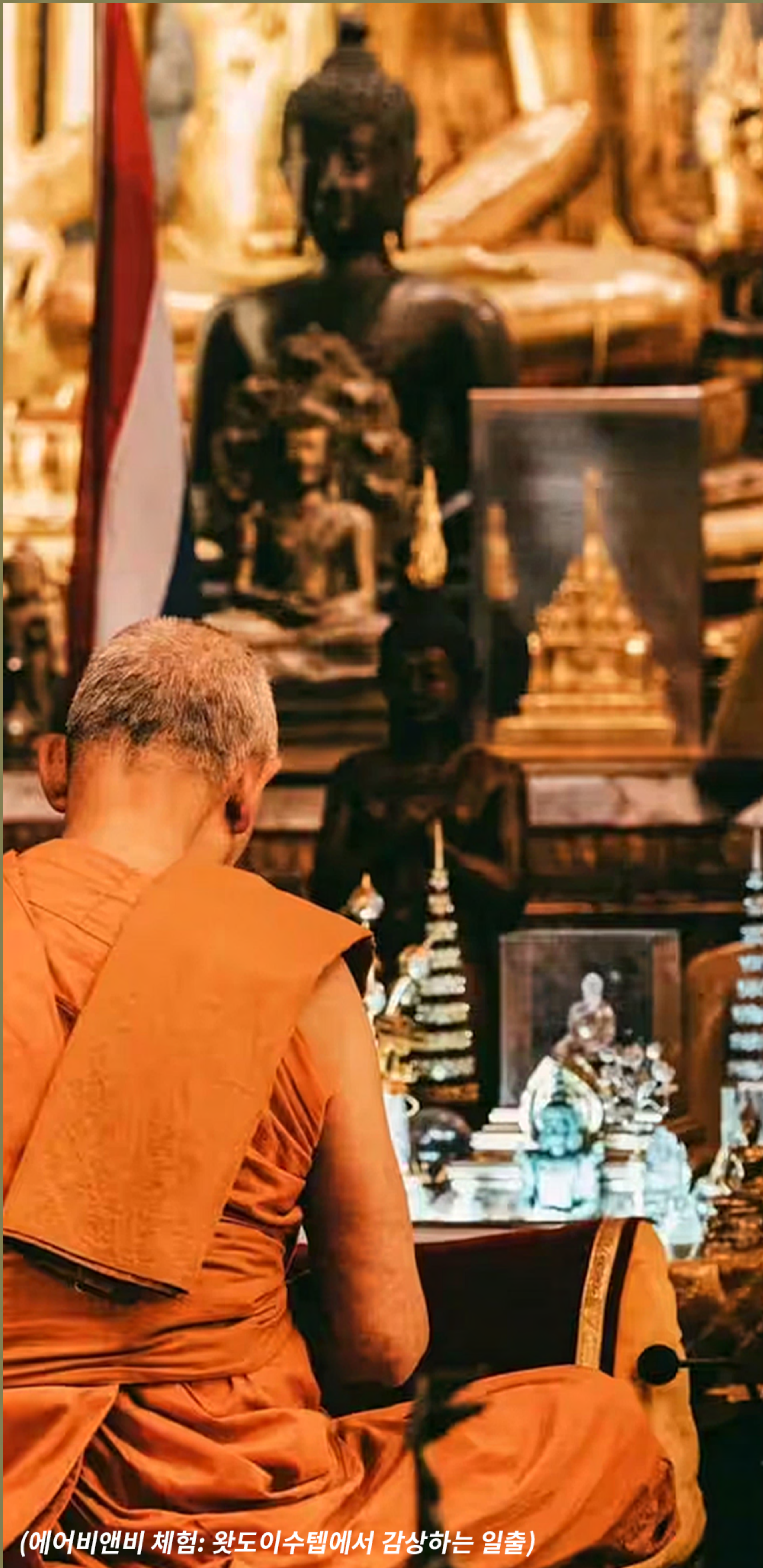
(에어비앤비 체험: 왓도이수텡에서 감상하는 일출)