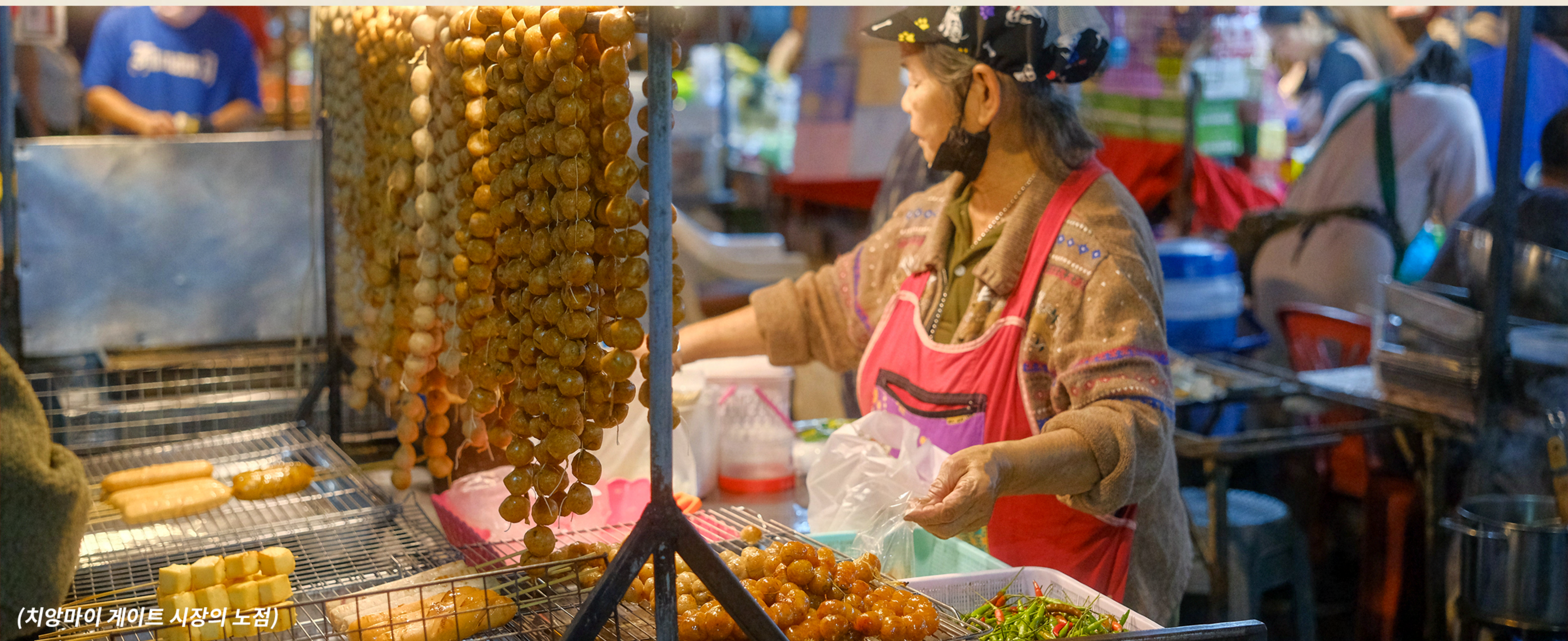
(치앙마이 게이트 시장의 노점)

이처럼 치앙마이에서는 길거리 음식부터 파인 다이닝에 이르기까지 전통미와 현대적인 감각이 어우러진 고유의 음식 문화를 만나볼 수 있습니다. 잊지 못할 미식 여행을 꿈꾸는 미식가라면 다양한 맛의 향연이 펼쳐지는 치앙마이를 꼭 한번 들러보시기 바랍니다.