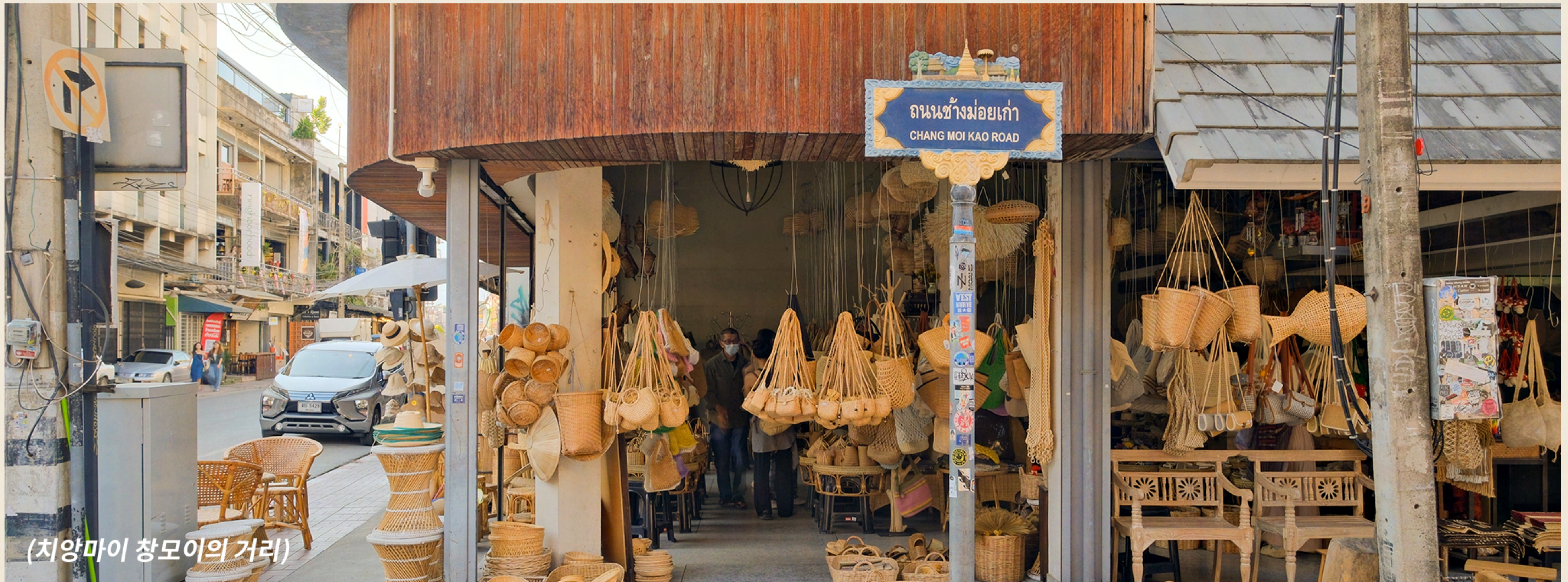
(치앙마이 창모이의 거리)

성벽으로 둘러싸인 구시가지 가까이에 자리한 창모이 는 예스러운 거리, 유구한 역사와 문화, 타페 게이트, 왓 체디루앙과 같은 상징적인 명소로 잘 알려진 지역입니다. 과거 무역의 중심지였던 이곳은 지금도 목각, 도자기, 직물 장인들이 모여드는 수공예의 메카이기도 합니다.