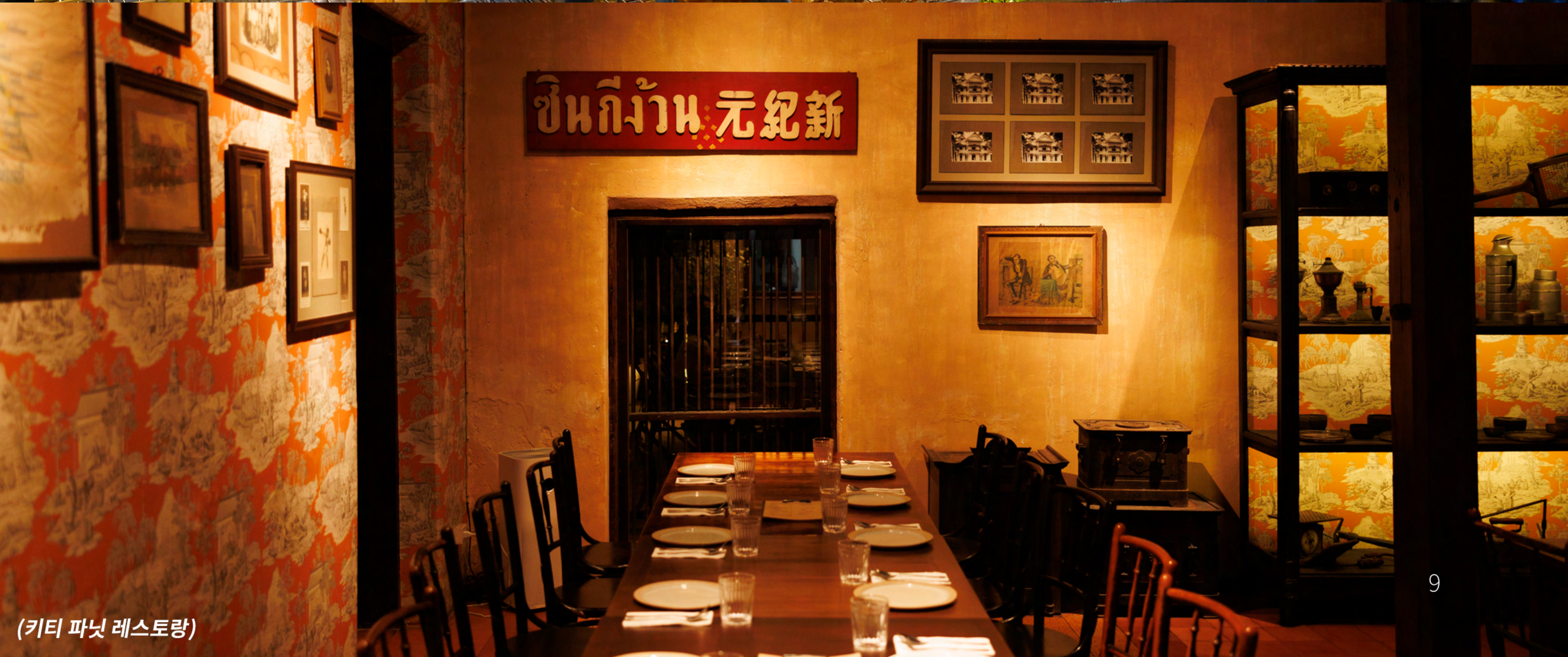
(키티 파닛 레스토랑)