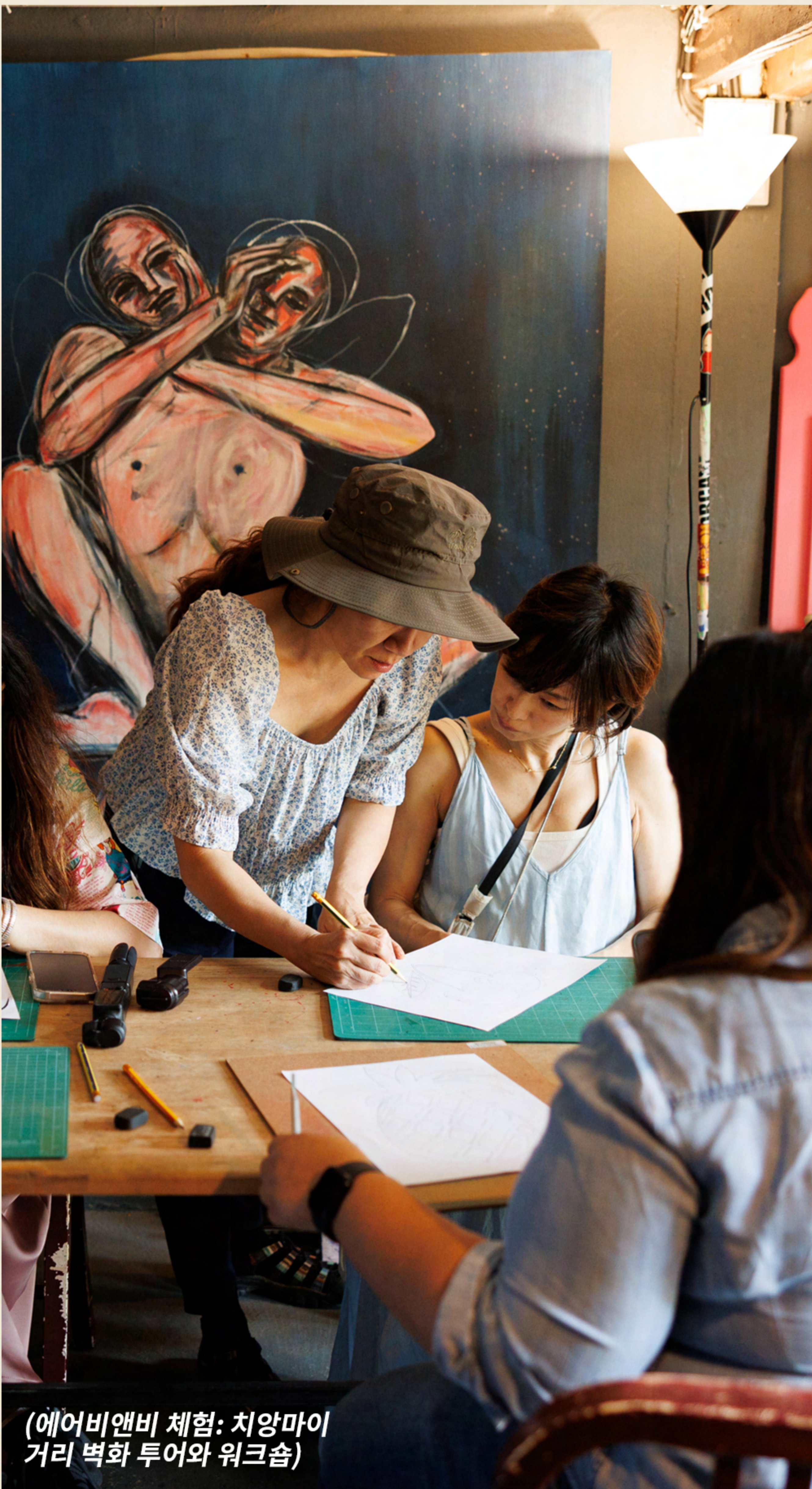
(에어비앤비 체험: 치앙마이 거리 벽화 투어와 워크숍)

“치앙마이는 전통과 현대적 창의성이 어우러져 예술이 활기차게 피어나는 곳이죠. 제 거리 벽화 체험은 이곳을 방문하는 이들과 현지 커뮤니티를 연결하고자 하는 바람에서 출발했어요. 게스트는 벽화를 그리는 체험에 참여함으로써 지역 빈곤 아동들을 위한 배움과 여가의 공간을 운영하는 데 도움을 줄 수 있죠. 체험 수익 일부가 제 공방에서 진행되는 미술 수업이나 지역 자선 프로젝트 후원에 사용되거든요. 치앙마이의 여유로운 일상과 어디서나 자연을 접할 수 있는 환경이 자신을 되돌아보고 창의적으로 표현할 수 있는 기회를 열어줍니다. 이곳은 단순한 여행지가 아니라, 예술을 통해 다른 사람들과 소통하고, 문화를 보존하며, 마음을 돌볼 수 있는 특별한 공간이에요. 그래서 여기에서 창작 활동을 하면 더 깊은 의미를 찾을 수 있죠.”