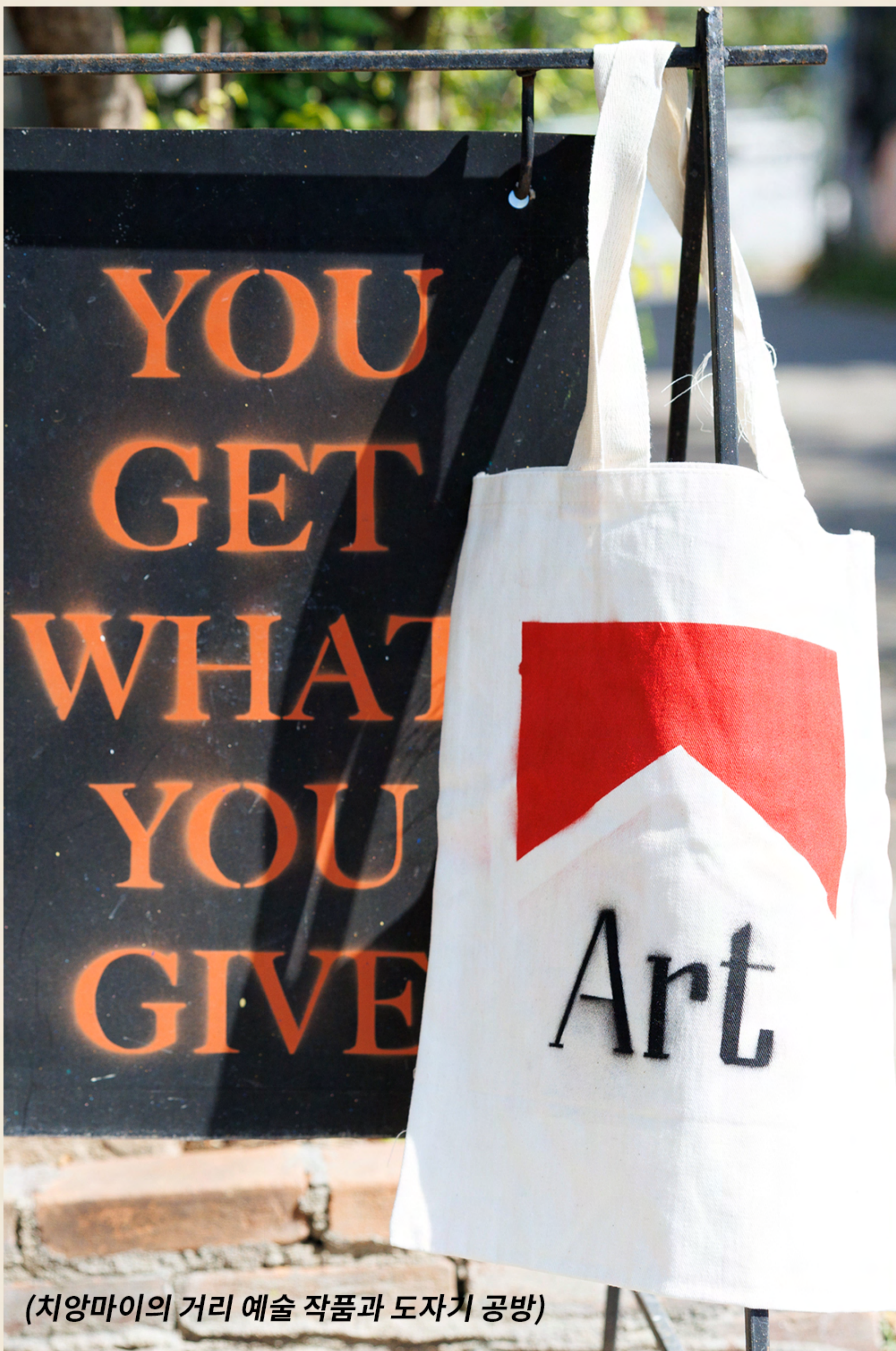
(치앙마이의 거리 예술 작품과 도자기 공방)

고대 란나 왕국의 수도였던 치앙마이는 태국 전통 공예의 중심지로, 이곳의 시장과 공방에서는 오늘날에도 전통적인 장인 정신이 살아 숨 쉬는 것을 느낄 수 있습니다. 목각, 은사 직조, 은세공 등 오랜 세월 대대로 전수된 전통 공예의 명맥을 잇는 활기찬 전통 공예 커뮤니티에서 치앙마이의 역사적 저력을 확인할 수 있죠. 예술적 전통과 현대적 감각이 조화를 이루는 수공예품에서도 이러한 전통문화에 대한 애착과 보존에 대한 의지를 확연하게 느낄 수 있습니다.