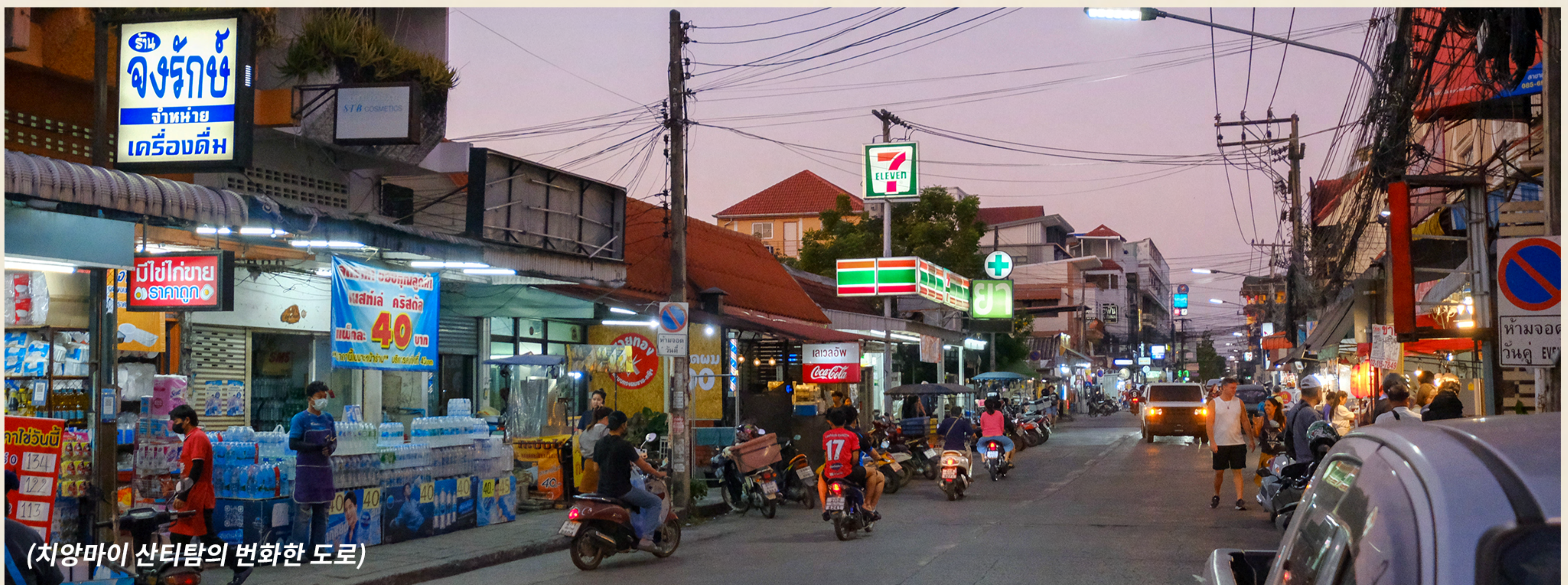
(치앙마이 산티탐의 번화한 도로)

예스러운 전통과 젊은 세대의 신선한 접근법이 만나 시너지를 발휘하며 현지 경제를 되살리고 있는 것이 창모이 만의 특별한 매력입니다. 특유의 편안하고 따뜻한 분위기를 만끽하며 조용한 거리를 걷다 보면 자연스럽게 아늑한 카페나 현지 음식을 파는 노점상을 만나게 되죠. 복잡한 도심에서 벗어나 조금 더 여유로운 분위기에서 치앙마이의 깊은 정취를 경험하기에 더없이 좋은 곳입니다.